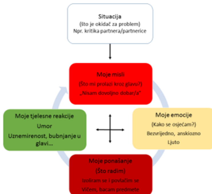
Slika 1. Odnos misli, emocija, tjelesnih reakcija i ponašanja u stresnim i neugodnim situacijama u partnerskom odnosu (prilagođeno prema („What is emotion regulation and how do we do it?“ http://www.selfinjury.bctr.cornell.edu/perch/resources/what-is-emotion-regulationsinfo-brief.pdf

No valja imati na umu da samoregulacija emocija nije potiskivanje emocija. Što više, samoregulacija emocija počiva na prepoznavanju i imenovanju svojih emocija, njihovom izražavanju na adekvatan način i u primjereno vrijeme, razgovoru o njima s ljudima u svojoj okolini, rješavanju problema i situacija koje su njihov uzrok, a i što manjem nakupljanja tih negativnih emocija u sebi i njihovom potiskivanju. Potiskivanje emocija može dovesti do lošijeg izražavanja vlastitih potreba, nerazumijevanja vlastitih emocija, ali i emocija drugih, što dovodi do poteškoća u socijalnim i partnerskim odnosima, kao što je uzajamno nerazumijevanje.